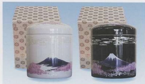
▲収骨セット（どちらかお選びください）