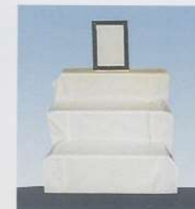
▲後飾り祭壇（写真別途）