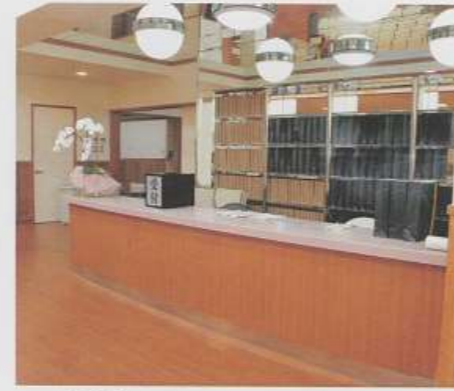
▲受付所（北館ホール葬）