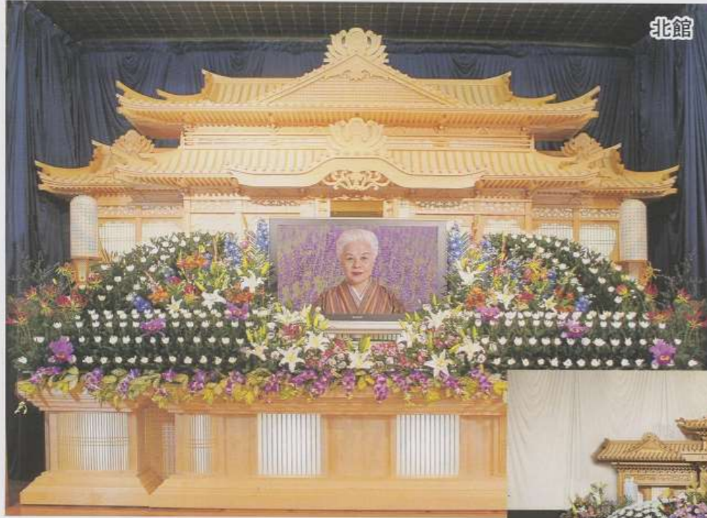
▲祭壇（北館使用時 生花祭壇） （自宅葬については現場合合わせのため形状が変わります）