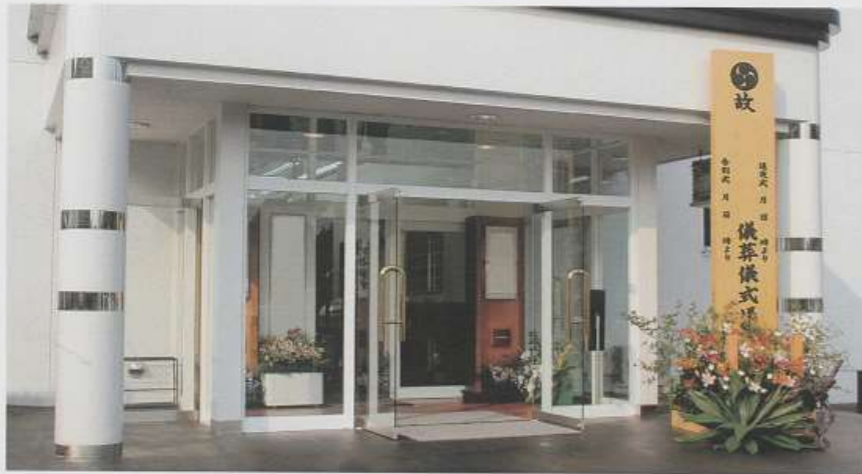
▲ホール表飾り（10尺白木看板は別途になります）