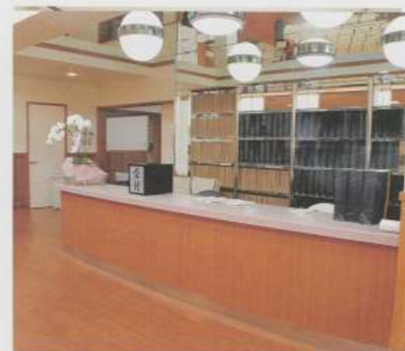
▲受付所 (北館ホール葬)