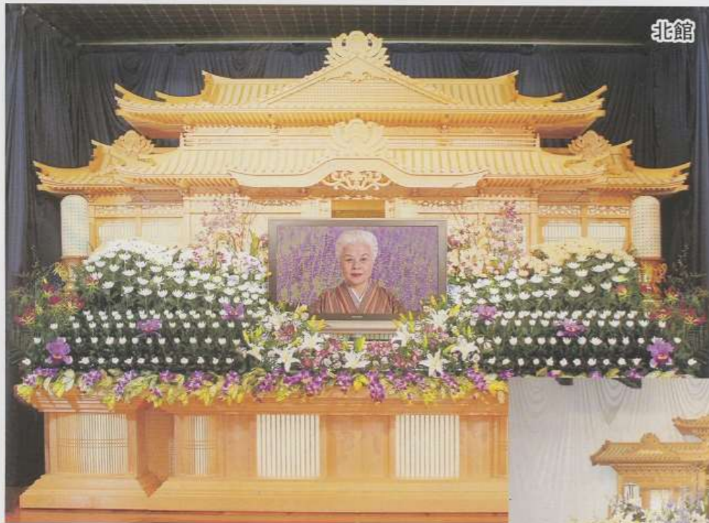
▲祭壇 (北館使用時 生花1段 シルクフラワー2段) (自宅葬については現場合合わせのため形状が変わります)