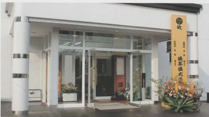
▲ホール表飾り (10尺白木看板は別途になります)