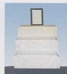
▲後飾り祭壇 (写真別途)