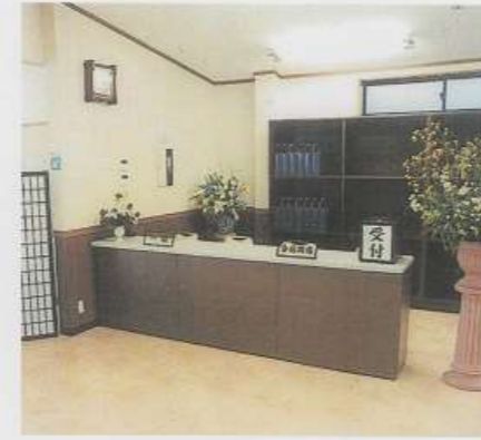
▲受付所 (南館ホール葬)