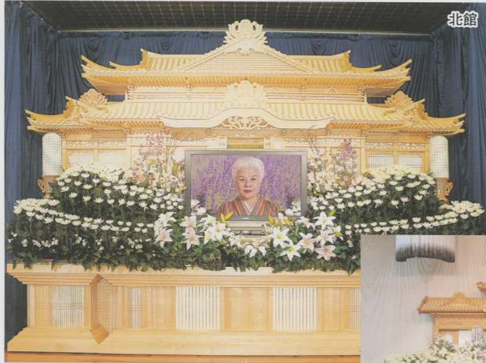
▲祭壇 (北館、南館 シルクフラワー飾り) (自宅葬の場合現場合わせとなり形状が変わります)