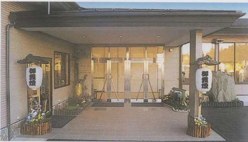
▲ホール表飾り (自宅葬については現場合わせのため形状が変わります)