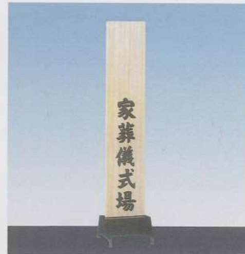
▲式場看板 (自宅葬、南館)