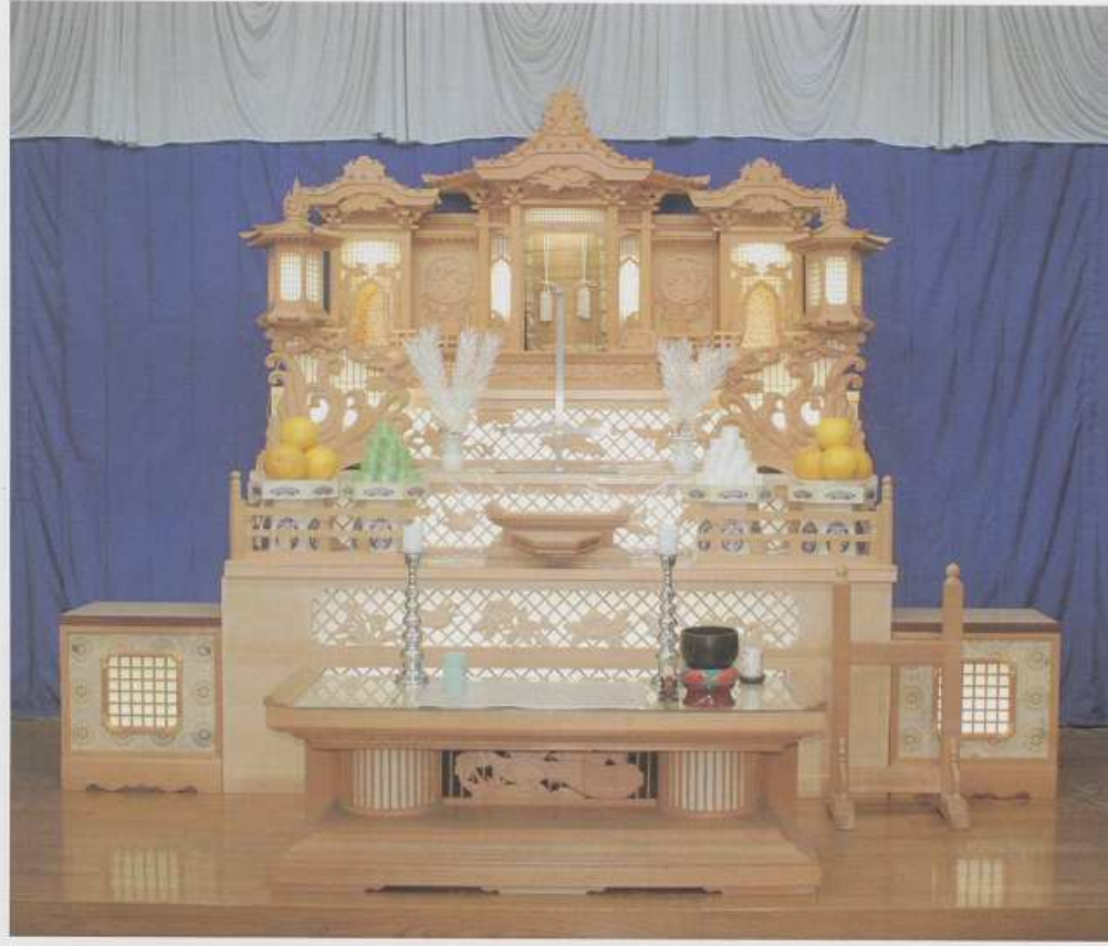
▲祭壇 (自宅葬については現場合わせになります) (供物は別途)