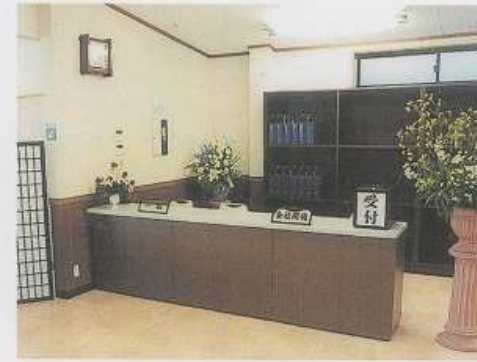
▲受付所 (南館ホール葬)