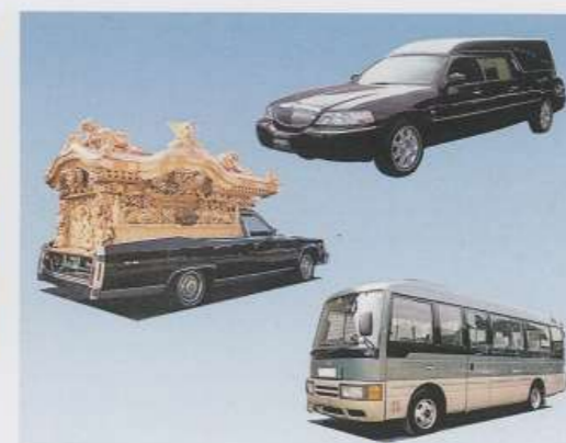
▲霊柩車（どれでも選べます）