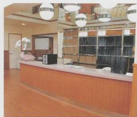
▲受付所（北館ホール葬）