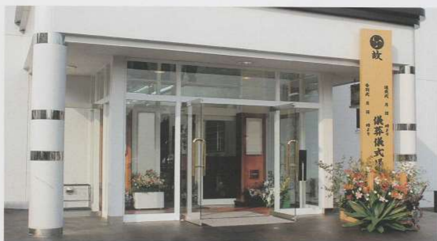
▲ホール表飾り（10尺白木看板は別途になります）